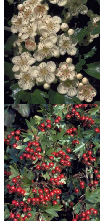
Weissdorn, oben die Blüten unten die Beeren

Beim Planen einer Hecke ist es wichtig auch an die spätere Bewirtschaftung zu denken: Wie soll die Hecke angelegt werden, damit der Krautsaum gemäht werden kann, ohne die angrenzende Fläche zu beanspruchen?