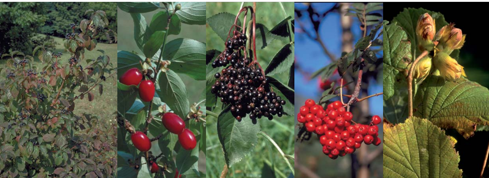
In einer artenreichen Hecke finden verschiedene Tierarten Nahrung wie Beeren, Nüsse usw. Hier eine kleine Auswahl von links nach rechts: Hartriegel, Kornellkirsche, Schwarzer Hollunder, Vogelbeerbaum, Haselnuss