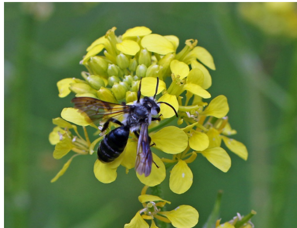
Senf-Blauschillersandbiene auf dem Senf