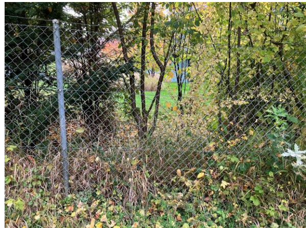
Abb. 8: Die Liegenschaften südlich des Hambergersteigs sind durch hohe bis auf den Boden reichende Zäune abgeriegelt.