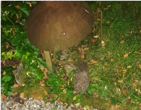
Abb. 2: Igelsichtung an der Kartausstrasse

Bis auf eine Einzelmeldung von der Enzenbühlstrasse in der südöstlichen Ecke des NimS-Perimeters wurden alle Igelbeobachtungen nördlich und westlich des Burghölzlihügels verzeichnet. Dabei zeigten sich zwei «Hotspots»: Im Dreieck Weinegg- / Kartausstrasse wurden mindestens drei Individuen gesichtet und zwischen Mühlebach- und Wildbachstrasse kam es zu mehreren Igelbeobachtungen (Abb.2 & 3). In der südwestlichen Hälfte des NimS-Perimeters gab es keine Igelbeobachtungen zu verzeichnen (Abb.6).