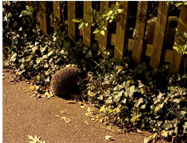
Abb. 3: Beobachtung an der Ceresstrasse