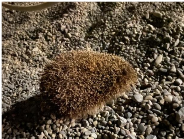
Abb. 11: Erste Igelbeobachtung von 2026 im NimS-Perimeter auf dem Schulhausareal Kartaus.

Eine schöne Zusammenarbeit ergab sich Ende 2025 dank der Initiative und dem Engagement einer Anwohnerin aus dem Quartier: Im neu erstellten, bis zum Boden reichenden Holzzaun der ABZ-Siedlung an der Mühlebachstrasse wurde bei allen Gartentörli eine Latte eingekürzt. So konnten insgesamt 6 neue Igeldurchgänge geschaffen werden ( Abb.12 ).