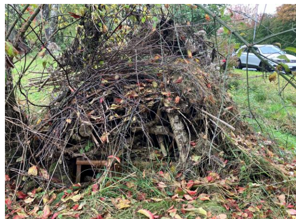
Abb. 5: Zusammengefallener Igelhaufen, Enzenbühlstrasse