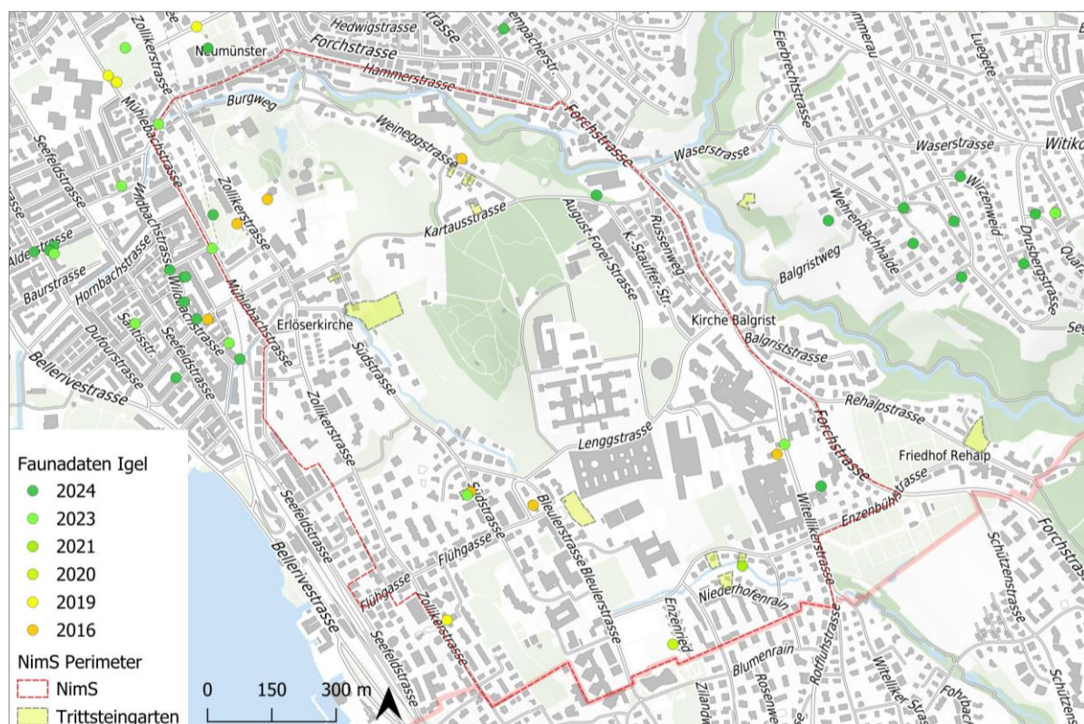
Abb. 1: Igelvorkommen rund um den Burghölzlihügel von 2016 -2024 (Faunadaten GSZ).

Auch in der Übersicht der Igel nachweise von 2016 – 2024 wird ersichtlich, dass rund um den Burghölzlihügel aktuell eine grosse Verbreitungslücke besteht (Abb.1).