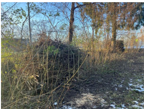
Abb. 9: Zwei der neu aufgebauten Igelhaufen aus angefallenem Schnittgut beim Enzenried.

Entlang der geplanten Vernetzung sollen möglichst viele Barrieren und Hindernisse abgebaut und durchlässig gemacht werden. Beim Hambergersteig könnten in Absprache mit der Grundeigentümerschaft Igeltunnels als Durchschlupf eingesetzt werden. Diese wurden von NimS in Zusammenarbeit mit dem Igelzentrum entwickelt, um Igel zu ermöglichen, von einem Garten in den andern zu gelangen, nicht aber unerwünschten Gästen wie Füchsen, Katzen oder Hunden (Abb.10). Zudem sollen die Vernetzungskorridore in Zusammenarbeit mit den Liegenschaftbesitzer*innen mit Igelverstecken und Kleinstrukturen ergänzt und aufgewertet werden.