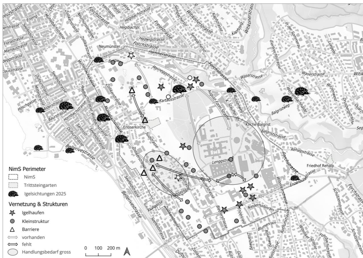
Abb. 6: Zusammengefasste Übersicht der Resultate. Die Grösse des Igelsymbols repräsentiert die Anzahl gemeldeter Igel, wobei die kleinste Grösse ein Einzeltier und das grösste Symbol für 3-4 Igelstichungen steht. Die Sterne markieren Standorte von Igelhaufen mit Hohlräumen, die Kreise symbolisieren weitere Kleinstrukturen wie Asthaufen oder Benjeshecken. Ein Kreis kann dabei auch für mehrere Strukturen stehen. (Swisstopo, bearbeitet).

In Abbildung 6 werden die kartierten Kleinstrukturen zusammenfassend dargestellt, die detaillierte Projektkarte findet sich im Anhang.