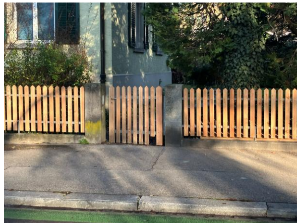
Abb. 12: Igeldurchgänge dank eingekürzten Latten in den Törli des neuen Holzzauns an der Mühlebachstrasse.

Aufgrund seiner Lebensraumsprüche ist der Igel Botschafter für die Bedeutung von Kleinstrukturen und die Vernetzung strukturreicher, naturnah gepflegter Gärten. In der Siedlungsökologie gilt der Igel auch als Schirmart, da von seiner Förderung zahlreiche weitere Arten profitieren, insbesondere solche, die auf Strukturen wie Ast- und Holzhaufen angewiesen sind.