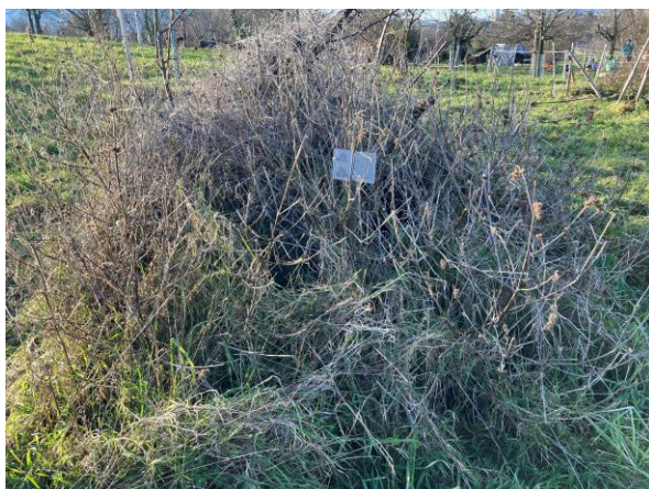
Abb. 4: Stark zugewachsener Igelhaufen, Wynegg

Zwei einst durch NimS erstellte Asthaufen, beide im Gebiet Enzenried, waren bei den Kartierungen nicht mehr vorhanden. Sie wurden aufgrund von Bauarbeiten entfernt oder weggeräumt.