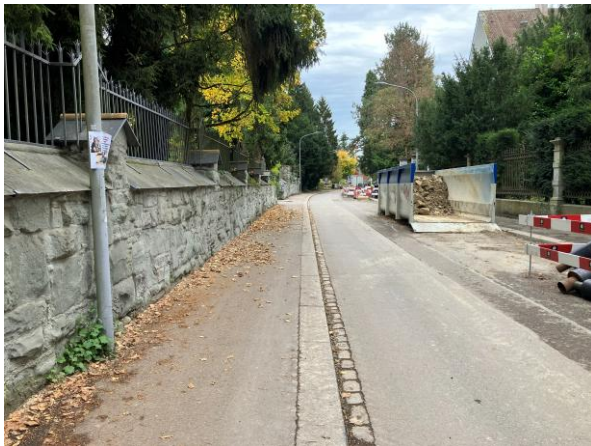
Abb. 7: Vielerorts säumen Mauern die Strassen und verhindern den Zugang zu den dahinterliegenden Grünflächen.

Im Rahmen des Projekts «Freie Bahn für Igel und Co.» von SWILD (2025) wurden um den Burghölzlihügel neue Durchgänge für Igel geschaffen, die meisten beim Familiengartenareal Lengg.