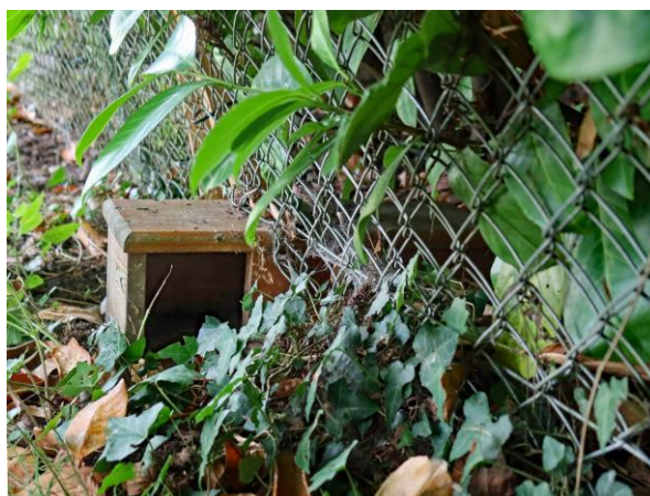
Abb. 10: Beim Hambergersteig könnten Igeltunnels als Durchgang für die Igel eingesetzt werden.